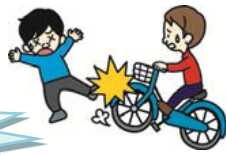
自転車で通行人にケガをさせた