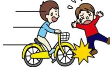
自転車にはねられてのケガ