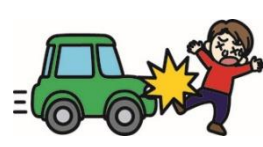
自動車にはねられてのケガ