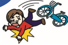
自転車で転んでのケガ