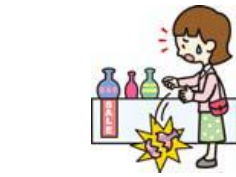
買い物中過って商品を壊した