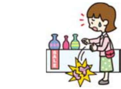
買い物中過って商品を壊した