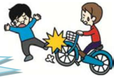
自転車で通行人にケガをさせた