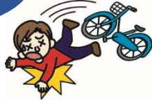
自転車で転んでのケガ