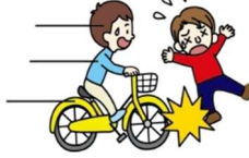
自転車にはねられてのケガ