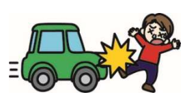
自動車にはねられてのケガ